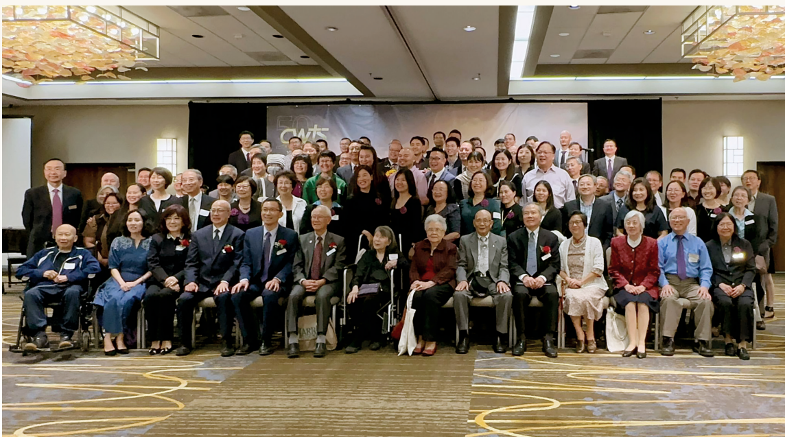
■ 感恩餐會後集體合影