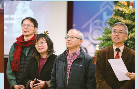
■ 聖誕聚會中的老師們