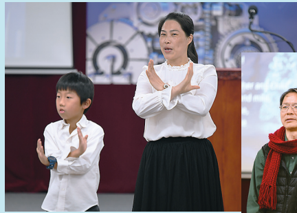
■ 聖誕聚會中的家屬