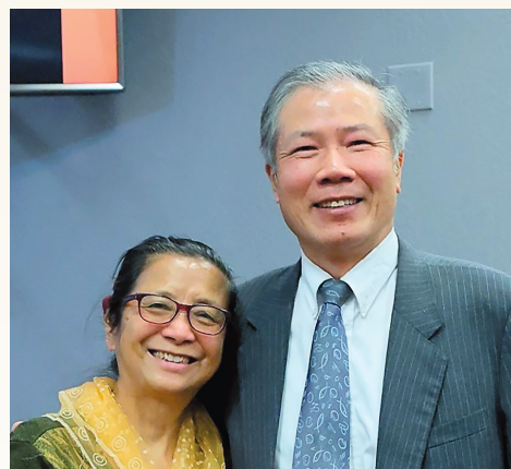
■ 呂牧師、呂師母亞特蘭大

第二個轉折點，是財務上能無赤字運作，並繼續維持穩定。作為信心機構，基神必須依靠信徒奉獻支持，才能順利培育教會領袖。因此，教授同工、同學都須要有受苦的心志，而院長更是加倍勞苦，為神學院張羅多樣資源。數