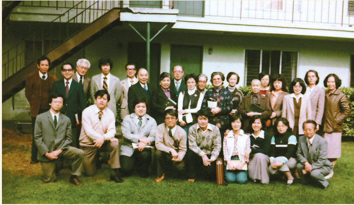
■ 早年柏克萊師生同工合照

基神有著正規神學院的地位，從合法社團單位註冊，教育單位登記，到高等學府頒發學位的批准，甚至移民局及海外領館批准簽證學府名單上，基神也是名列其中。在這四年院長生涯中，我蒙神的恩典及各層面單位的愛護，得到許多機會與方便，其中之一是被加州政府高等教育部委任為六人委員會視學官，專門視察審查加州境內之神學院及神學機構的運作和合法地位的批准。基神地位的提升，畢業同學的高素質，常常得到各地教會及社會的公認、接納和稱許，使我們大得鼓勵。這一間在北美華人基督教历史上維持最長久，又最具影響力的神學