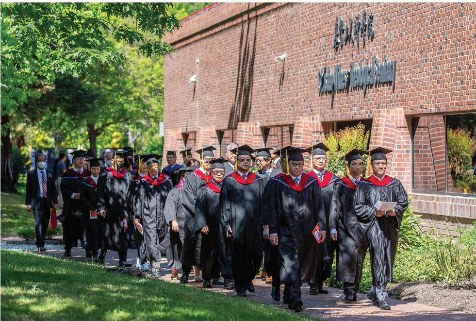
■ 畢業生主禮團入場