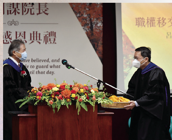
■ 就職感恩典禮上的職權交接儀式

是低處的，是別的受造之物，都不能叫我們與神的愛隔絕。”（羅8:38-39）。如果教會有如此的堅信，就能使用大流行病的危機為傳福音的契機。能夠穩穩地立於信仰的磐石上，需要有堅強而恆韌的屬靈操練生活。這沒有捷徑，不是學習一門靈命塑造的課程就能達到，唯有常年累積下來的操練才能達成。靈命塑造是基神一直來的重中之重。多年來，基神全體學生每天早晨八點鐘，在