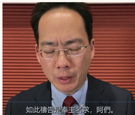
如此禱告是奉主名求，阿們。