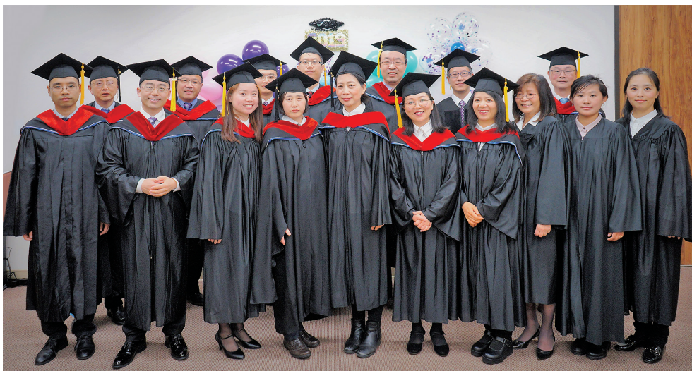
■ 走出校園，奔向禾場。

六年邊工作邊讀書的神學學習終於告一段落。幾年下來家庭、教會事奉和工作都沒有耽誤，也沒有忙到焦頭爛額。我深深體會到這是神的恩典和保守，因此十分感恩。家庭的支持也是使我讀下去的一個重要力量，家裏人共同的看見，讓我能專註學習。