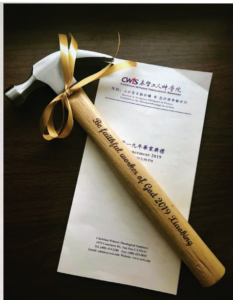
■ 謹記學院的託付——忠心為主工作

我最大的收穫是在聖經、神學和教會歷史上眼界變開闊。學習中的思考和知識的積累，使我對基督信仰更有確據，服事的心志也隨之加深；最大的挑戰是專文的寫作。對於理工背景的我，寫作如登高山一般艱難。但經歷之後所獲得的收穫卻是無價的、終身受用，這樣的訓練是無法在別處能得到的。感謝基神老師和員工們的擺上和付出。神學教育在眾教會的普及是神國度擴張的重要一環。■