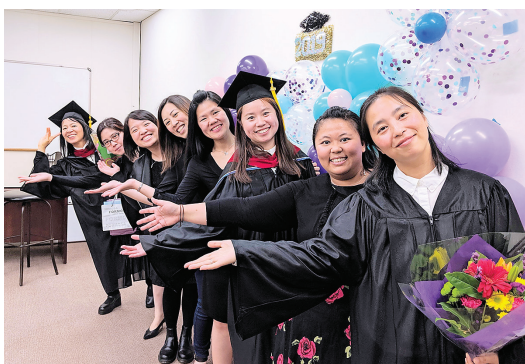
■這是耶和華所定的日子